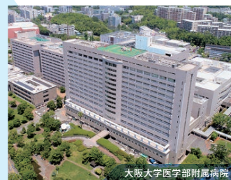
大阪大学医学部附属病院